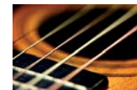
«La città dalle mille corde»